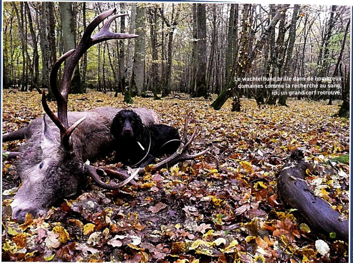
Le wachtelhund brille dans de nombreux domaines comme la recherche au sang, ici, un grand cerf retrouvé

le club travaille à travers des épreuves de travail adaptées, dans le sens d'une parfaite et totale polyvalence.