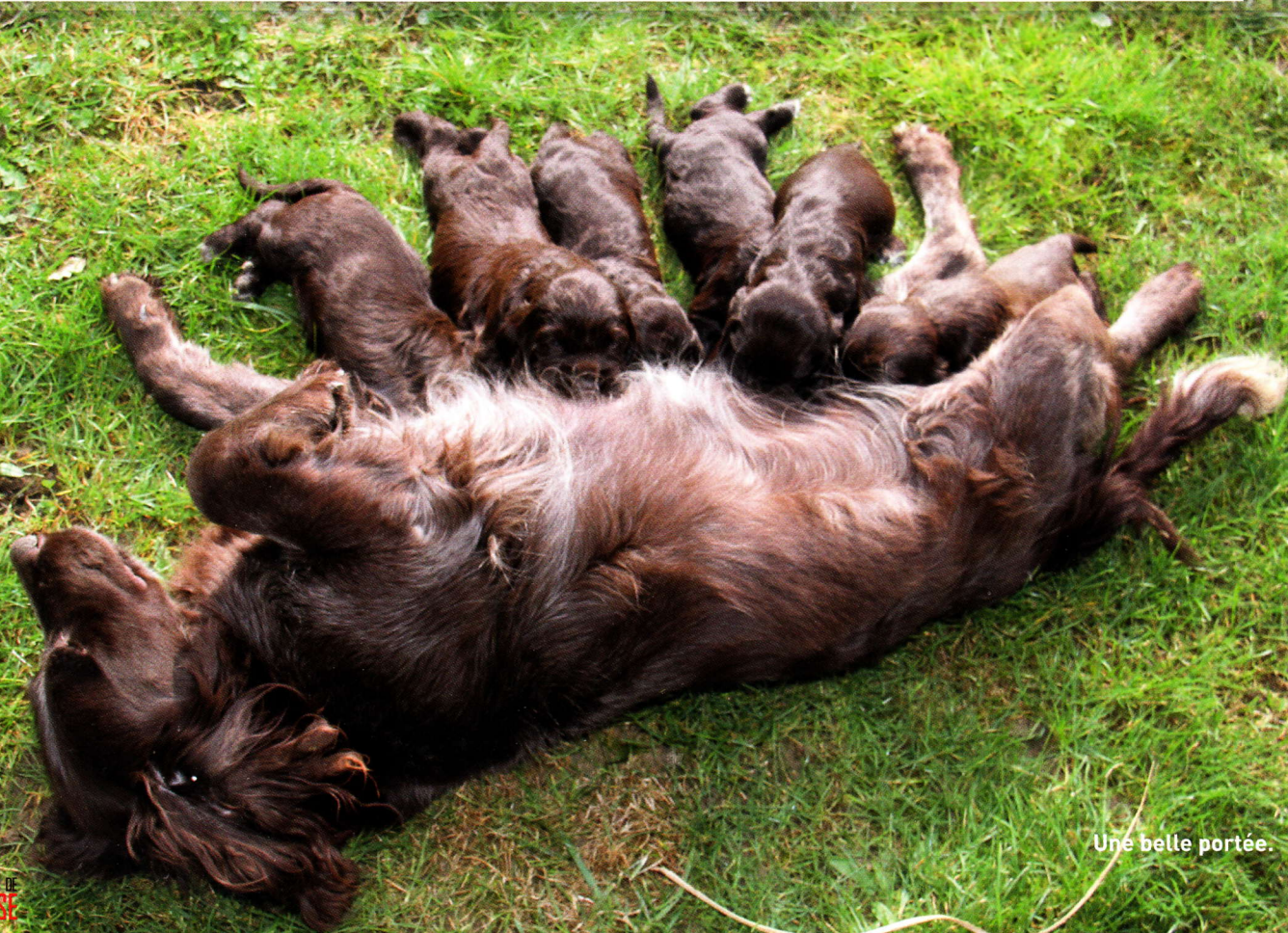
Une belle portée.

la recherche du gibier blessé ; leueur de gibier et chien de chasse polyvalent dans les halliers, les terrains fortement boisés et dans l'eau.