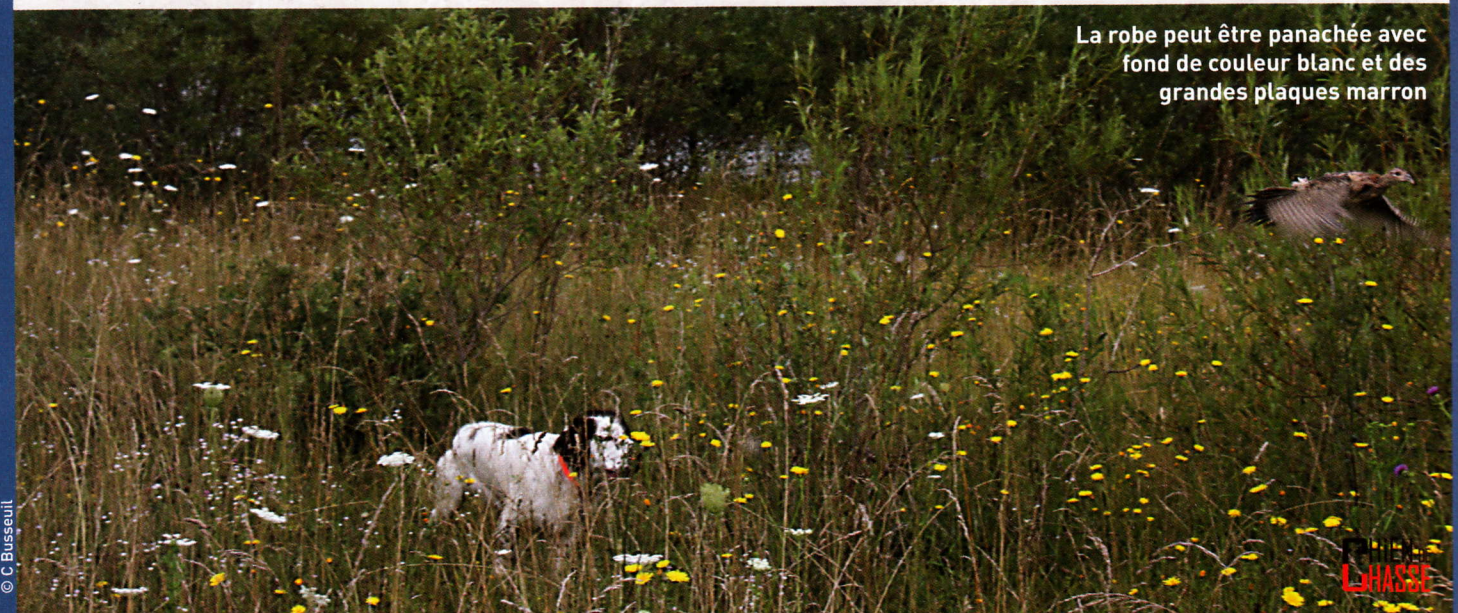
La robe peut être panachée avec fond de couleur blanc et des grandes plaques marron